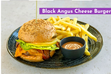
Black Angus Cheese Burger