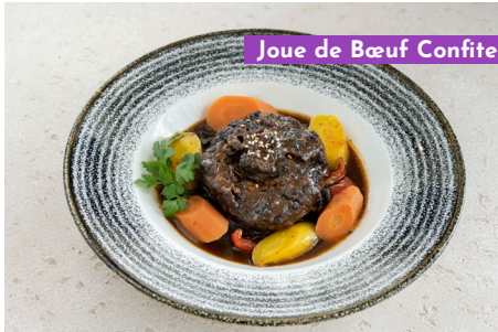
Joue de Bœuf Confité