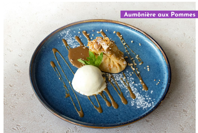
Aumônière aux Pommes