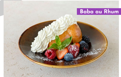
Baba au Rhum