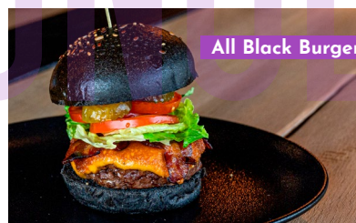
All Black Burger