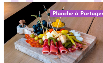
Planche à Partager