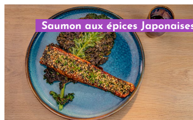
Saumon aux épices Japonaises

Saumon mariné, bun's roll, légume racine, mayonnaise citron-gingembre, pomme, salicorne new Marinated salmon, bun's roll, root vegetable, lemon-ginger mayonnaise, apple, samphire