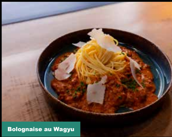
Bolognaise au Wagyu