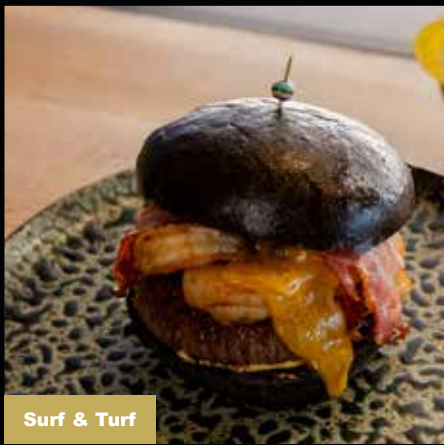
Surf & Turf