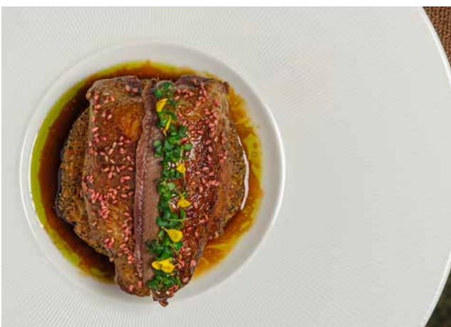
Pigeonneau Cuit sur Coffre Pomme Dauphine • Cuisse Confitée aux Anchois • Jus à la Bière Ambrée Brasserie Papillon