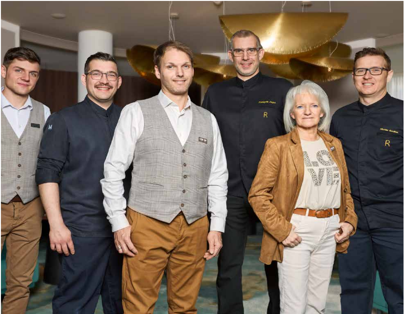
L'équipe du Restaurant