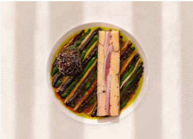
Foie Gras & Suprême de Caille Pressé Morille Farcie • Ail des Ours • Ail Noir