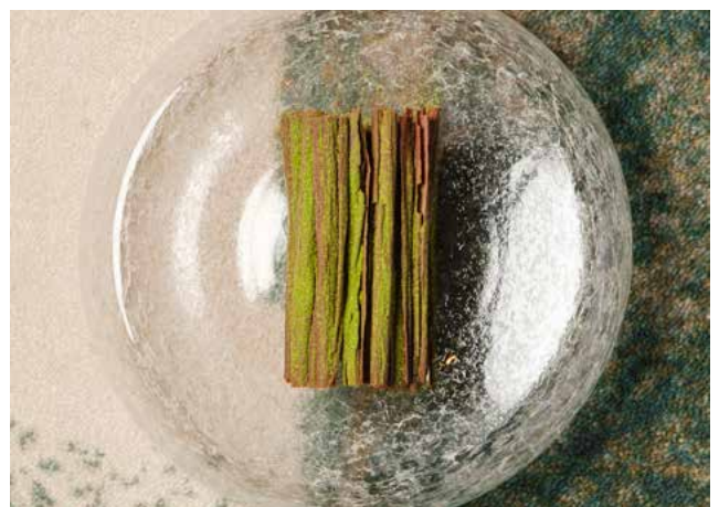
Chocolat Vanuari 63 % Sorbet Betterave • Gianduja • Poudre de Shiso