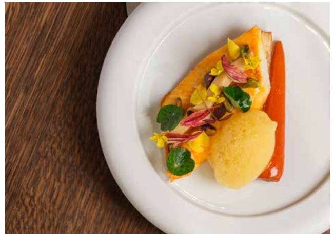
Saint Pierre Confit Carottes Glacées au Timut • Rhubarbe Grillée • Beurre Rouge